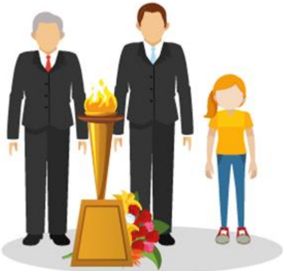
MINUTE DE SILENCE