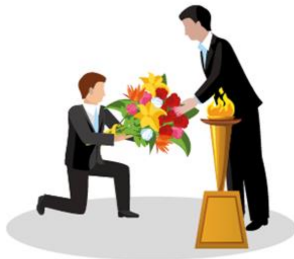
DÉPÔT DE GERBE