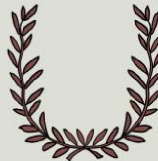
Couronne de laurier