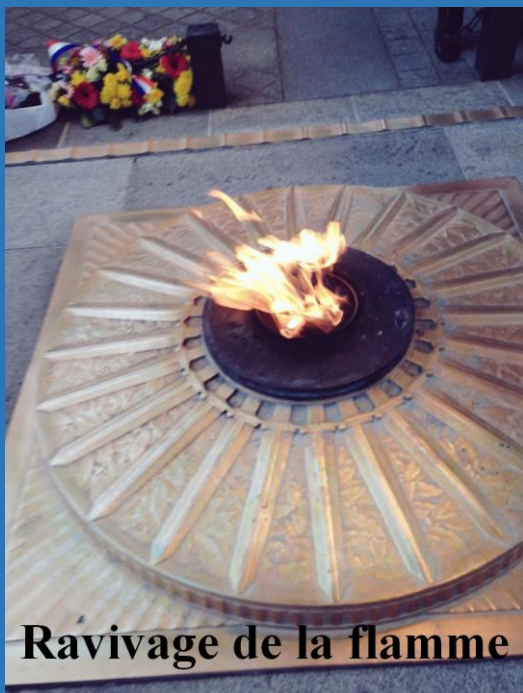
Ravivage de la flamme