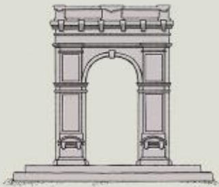
Arc de triomphe