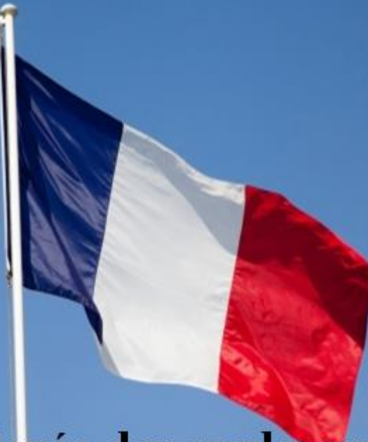
La levée des couleurs