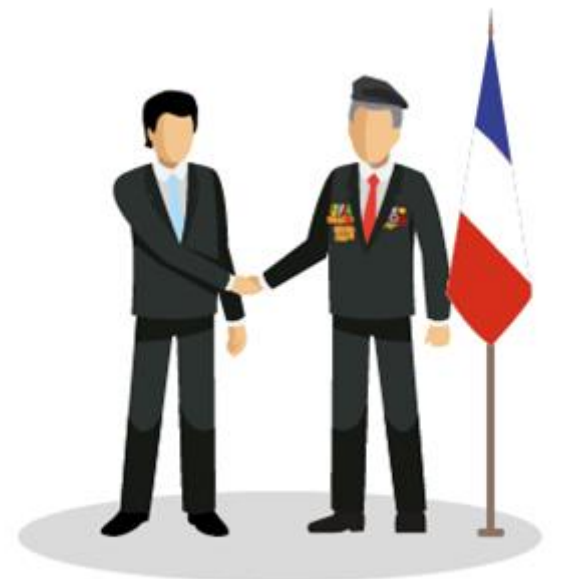
SALUT AUX PORTE-DRAPEAUX