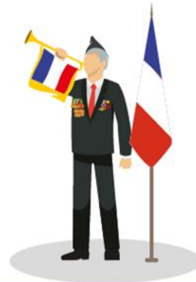
SONNERIE « AUX MORTS »