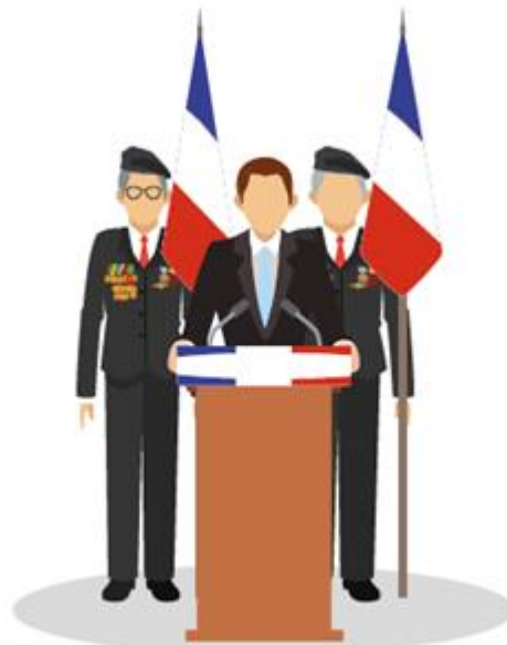
PRISE DE PAROLE DANS L'ORDRE PROTOCOLAIRE